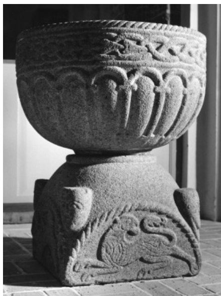
Døbefont fra Vejerslev kirke i Viborg stift.

Efter 1060 tog kirke byggeriet i Jylland fart - mest trækirker dog med døbefonte i sten. Døbefonten her blev fundet i kirkediget ved Vejerslev kirke. Den var revnet og havde rester af bemaling. Man regner med at alle runesten og stenfigurer var bemalede i vikingetiden. Fonten har tovsnoninger, ringkæde, arkader og lavt relief, der alle kendes tidligere fra engelsk stenhuggertradition. Fonten har ikke stået i den nuværende Vejerslev kirke, men sandsynligvis i den første trækirke bygget efter bispedømmets oprettelse. I Viborg stift findes to andre døbefonte tydeligvis fremstillet af den samme stenhugger. I Vindblæs kirke i Viborg stift har den oprindelige indgangsportal ringkæde og løvefigurer der minder om Jellingstenens løve. I Viborg by er der fundet en sokkelsten fra en nedlagt kirke med ringkæde og arkader.